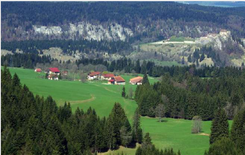
Belvédère de la Roche Sarrazine (Paul Verniau)